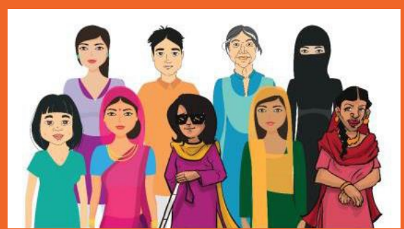
ہر پاکستانی کا حق

حکومت اور اس کے ذیلی ادارے شہریوں کی خدمت کے لیے ہمہ وقت کوشاں ہیں۔ یہ کتابچہ ضلع سرگودھا کے سرکاری اور غیر سرکاری اداروں کی طرف سے فراہم کردہ سہولیات / خدمات سے متعلق اہم معلومات فراہم کرتا ہے۔ اس کتابچے کو NRSP نے آواز دو پروگرام کے تحت شہریوں کی راہنمائی کے لئے مرتب کیا ہے۔