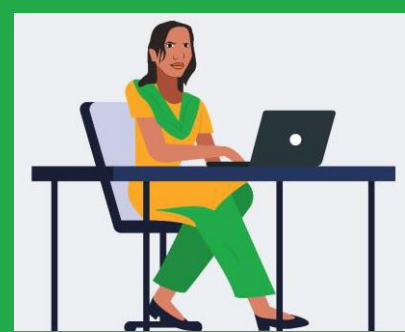
تعلیم، قابلیت اور روزگار بلا امتیاز رویہ کے ساتھ