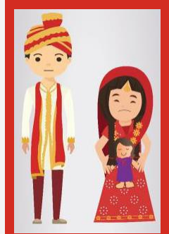
کم عمری کی شادی عمر بھری بربادی